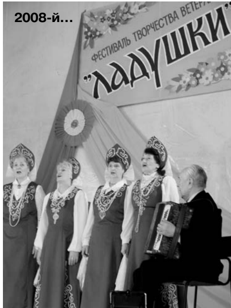
2008-й... Как обычно, требование к участникам одно – быть творческим челове-

В этом году уже в пятый раз состоится ежегодный Фестиваль творчества «Ладушки», который проводит Совет ветеранов Майской Горки при поддержке депутатов, администрации, общества инвалидов, Женсовета и общественного Совета округа. Фестиваль проводится в рамках реализации социальной программы «Старшее поколение», а этом году он еще посвящен 50-летию полета Юрия Гагарина и 20-летию округа Майская Горка.